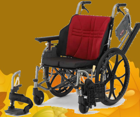
↑ Gra-Fit (多機能 自走)