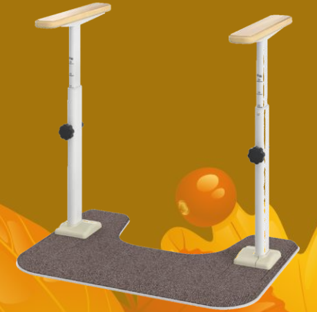
↑ アットグリップ トイレサポート