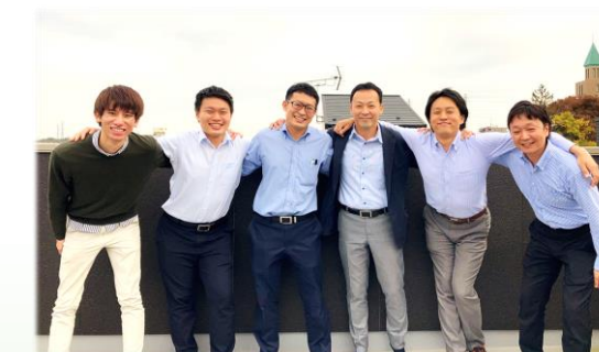
我ら相談員が親身にお話を伺います!!