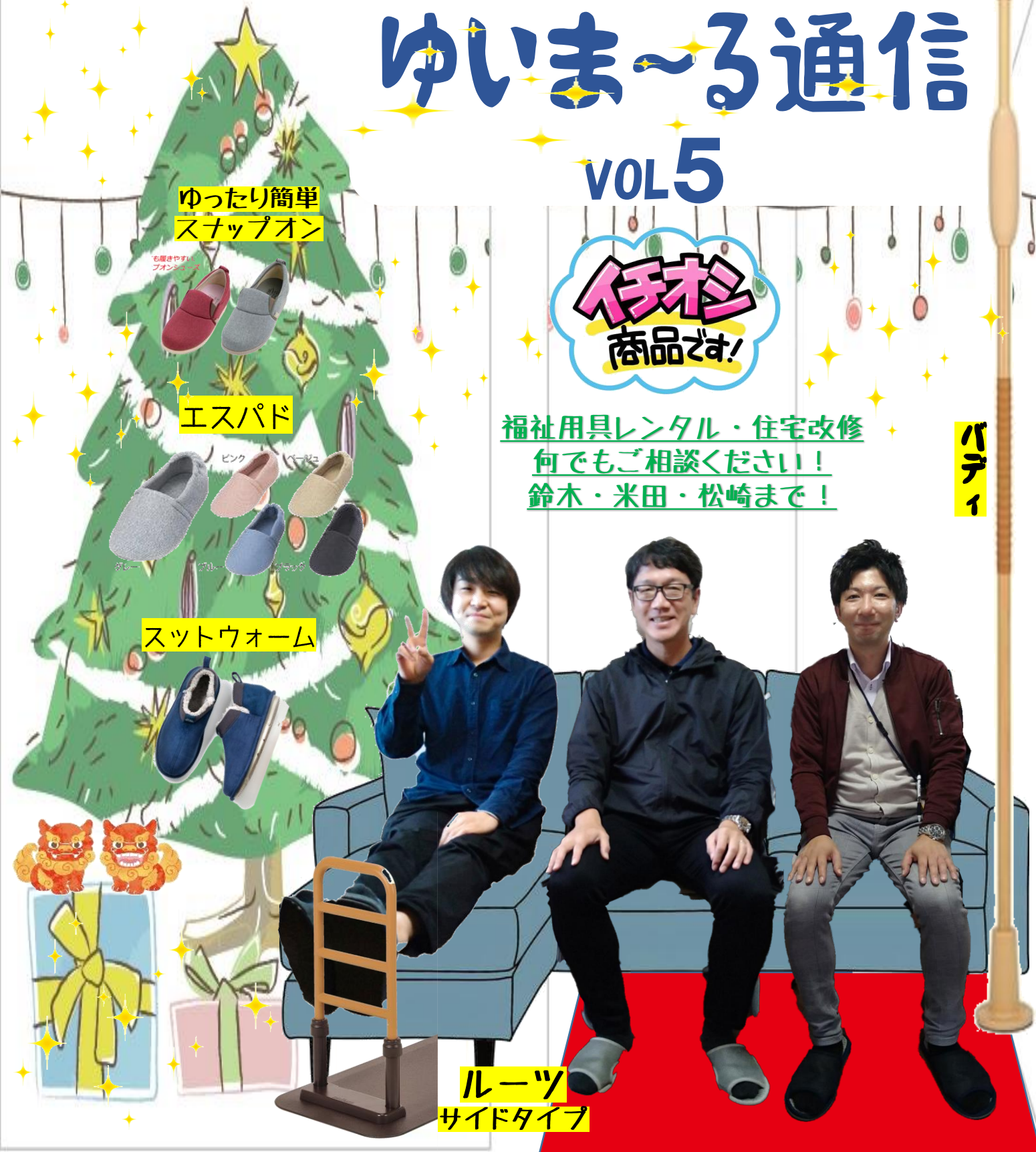
ゆったり簡単 スナップオン