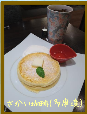
さかい珈琲(多摩境)