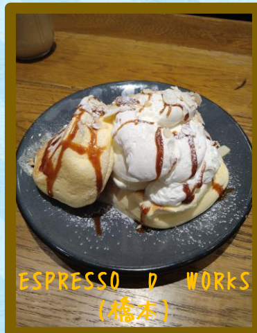
ESPRESSO D WORKS (橋本)