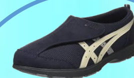
ライフウォーカー101 (紳士用)

こちらの写真のたけのこは山で撮影した写真…じゃなく…そうなんです。ゆいまーる庭に生えてきたたけのこなんです('Д')ビックリです！たけのこの生命力は強いですね！