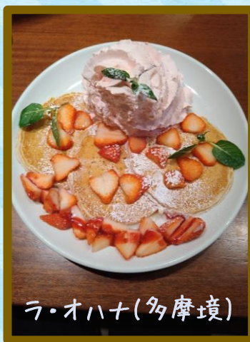
ラ・オハナ(多摩境)